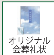
オリジナル 会葬礼状