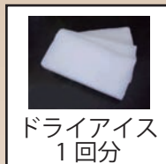
ドライアイス 1回分